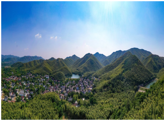
绿意盎然的仰峰村。