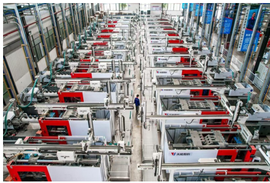
俯瞰天能集团浙江昊杨新能源科技有限公司智慧工厂。