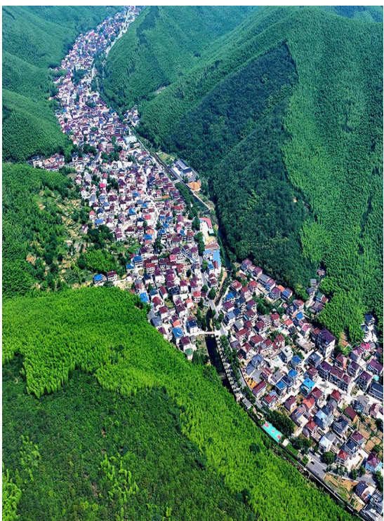
青山环抱的新川村。