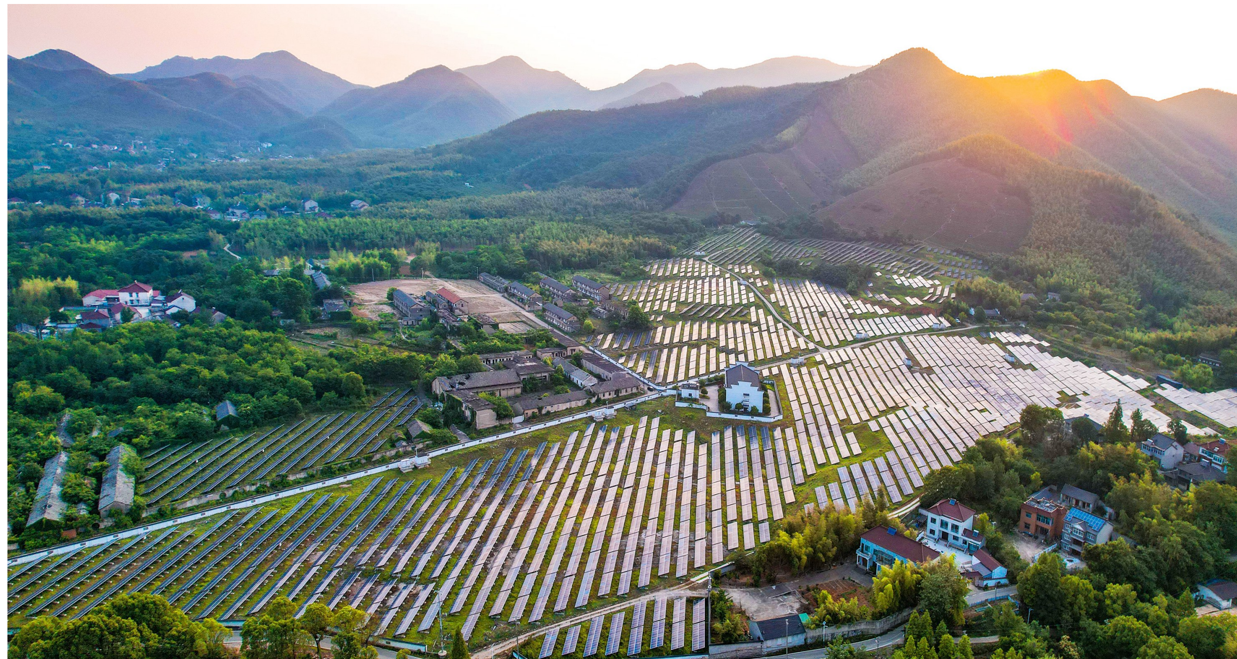
昔日的长广煤矿摇身一变,成了太阳能光伏基地。