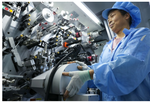
在浙江七星电子股份有限公司自动线无尘车间,工人操作卷绕设备。