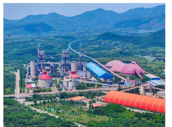
湖州槐坎南方水泥有限公司架起水泥熟料运输“天路”。