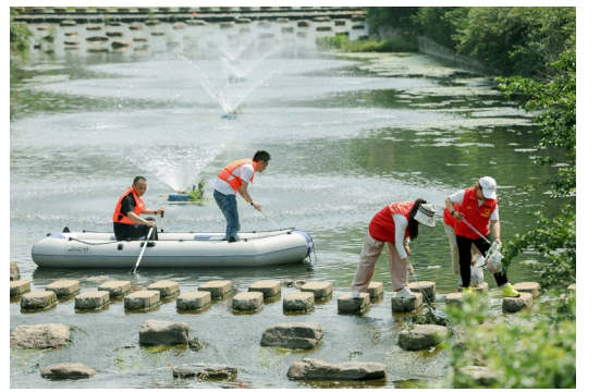
志愿者在新川村清理河道,保护水环境。