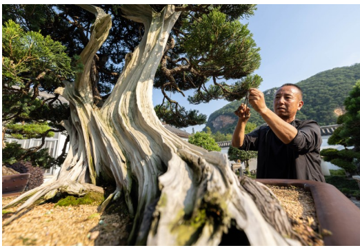
农户在仰峰村盆景专业合作社管护盆景。