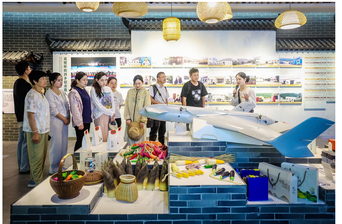
采访团参观新川村初心馆。