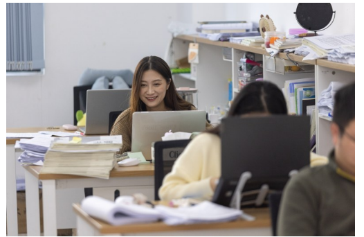
在办公室制作教学课件。