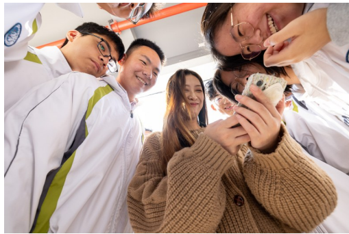
师生们一起回味微博热搜视频。