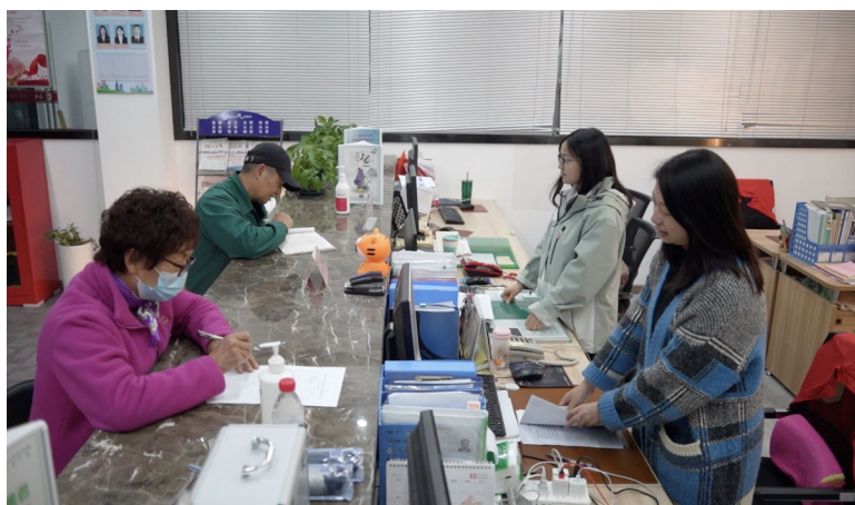
▲3月13日晚,南太湖新区仁皇山街道仁皇山社区居民在“延时服务”期间办理业务。

仁皇山街道相关负责人表示,居民可前往已开展延时服务的社区进行事务办理,也可积极参与社区组织的公益活动。下一步,仁皇山街道各个社区将总结可推广、可复制的工作经验,探索现代化社区建设,提升服务效能,持续完善社区服务制度。