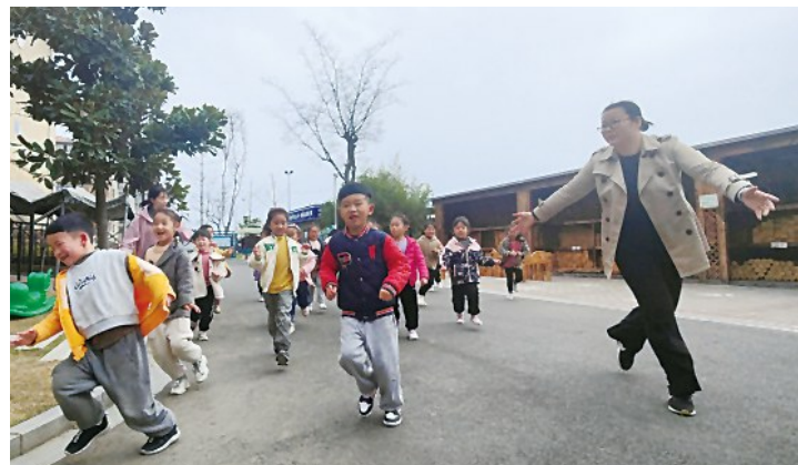
图为当天演练现场

此次演练活动,充分考验了教职工的安全防范意识以及应对暴力突发事件的处置能力,推动了幼儿园反恐防暴安全工作的有效开展。